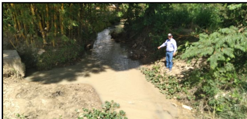
FOTOGRAFÍA N°02: SE OBSERVA LA QUEBRADA COLMATADA EN VARIOS TRAMOS