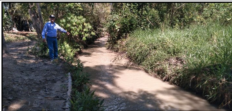
FOTOGRAFÍA N°01: SE OBSERVA MALEZAS LIGERAS EN BORDE